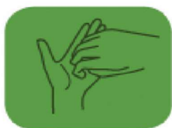
frottez les ongles et le bout des doigts

La méthode est importante. Le savon seul ne suffit pas à éliminer les germes. C'est la combinaison du savonnage, frottage, rinçage et séchage qui permet de se débarrasser des germes ;