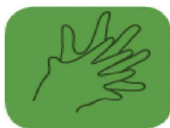
frottez entre les doigts