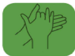
frottez la paume des mains