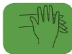
frottez à l'extérieur des mains