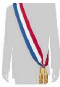
écharpe portée par un député ou un sénateur