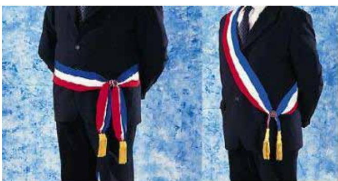
les deux façons de porter l'écharpe tricolore pour un maire ou ses adjoints

Le port de l'écharpe tricolore est le signe le plus distinctif de l'autorité des élus. Elle se compose d'un tissu bleu, blanc et rouge et, est dotée, à son extrémité de deux glands dont la couleur diffère en fonction du mandat. Pour les élus, maires, le bleu est en haut, les glands sont dorés. Pour les parlementaires le rouge est en haut. L'écharpe tricolore se porte sur l'épaule droit ou comme avant 1830, à la ceinture, l'ordre des couleurs fait figurer le bleu en haut.