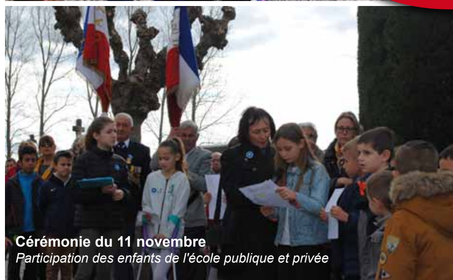
Cérémonie du 11 novembre Participation des enfants de l'école publique et privée

Pour que les enfants des écoles comprennent le pourquoi de cette guerre, les poilus, les tranchées, la bataille de Verdun... l'ONAC leur a offert à chaun un livret "La guerre 14-18 expliquée aux enfants".