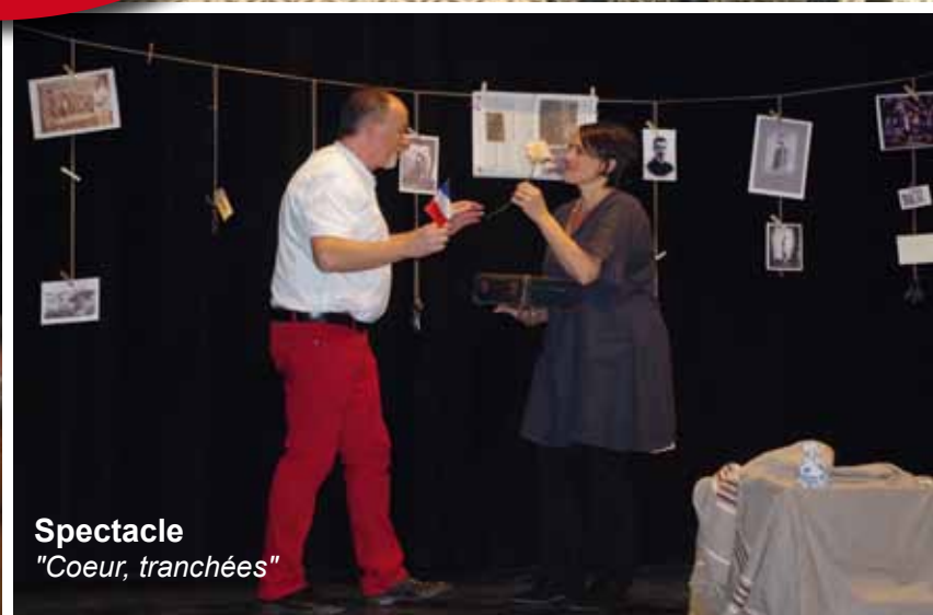
Spectacle "Coeur, tranchées"